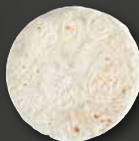
TORTILLA 6" Varenr. 102521 · EPD: 6043731