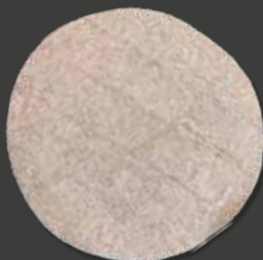
WHOLE WHEAT TORTILLA 8" Varenr. 102063 · EPD: 5349638