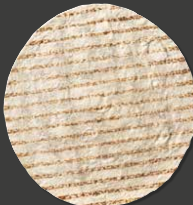
TORTILLA MED GRILLMERKER 12" Varenr. 102382 · EPD: 6043806