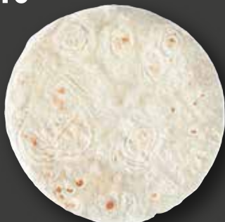
TORTILLA 10" Varenr. 4992 · EPD: 2319788