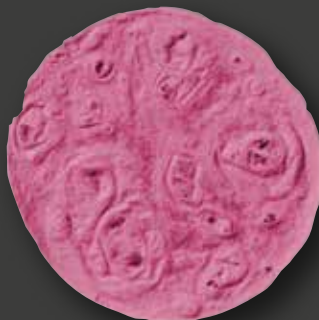
TORTILLA BEETROOT 10" Varenr. 102278 · EPD: 5802087