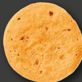
TORTILLA CARROT 10" Varenr. 102279 · EPD: 5909346