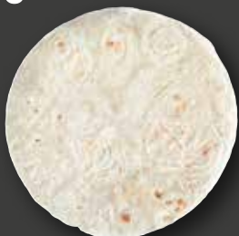
TORTILLA 8" Varenr. 4991 · EPD: 2319770