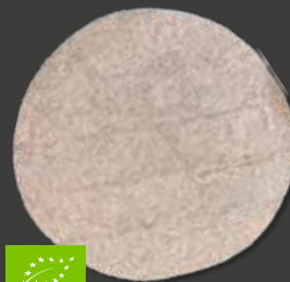
ORGANIC WHOLE WHEAT TORTILLA 8" Varenr. 102062 · EPD: 5349592