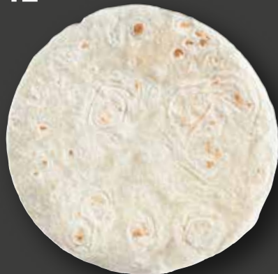
TORTILLA 12" Varenr. 4786 · EPD: 2012458