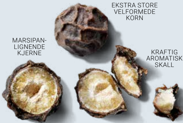
EKSTRA STORE VELFORMEDE KORN