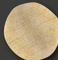
MAIS TORTILLA 6" ❄️ Varenr. 4942 · EPD: 4355624