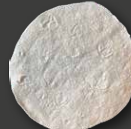
TORTILLA GLUTENFRI 8" Varenr. 200715 · EPD: 5909346