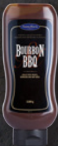
BOURBON BBQ SAUCE 1100 G ART NR: 4541