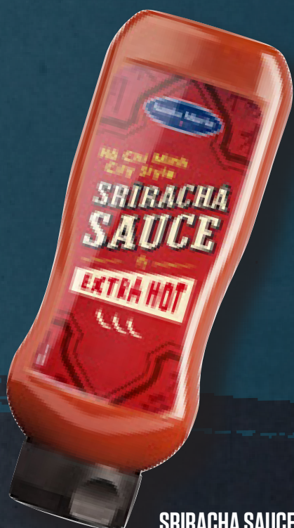
SRIRACHA SAUCE 980 G ART NR. 200107 En stærk topping- og dipsauce med chili.