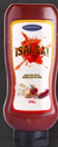
SALSA 950 G ART NR: 4557