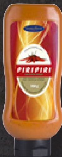
PIRI PIRI SAUCE 950 G ART NR: 4538