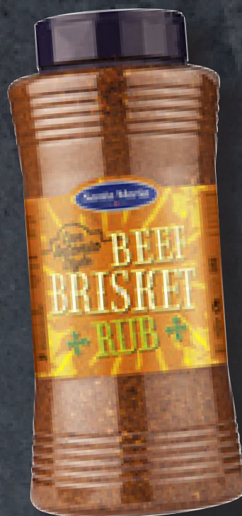
BEEF BRISKET RUB 600 G ART NR. 100272 En krydderiblanding til simremad med oksekød.