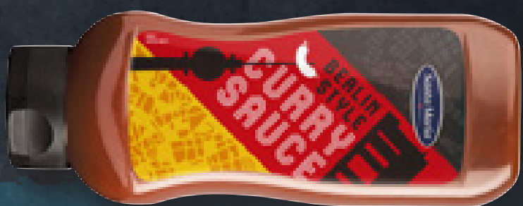
CURRY SAUCE 1000 G ART NR. 200105 En stærk tomatsauce - perfekt til gourmetpølser.