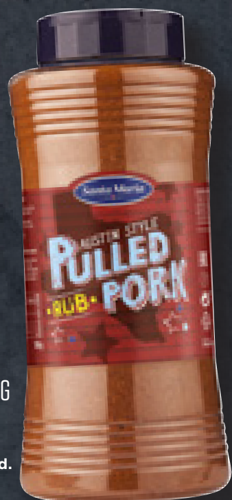
PULLED PORK RUB 550 G ART NR. 100271 En krydderiblanding til simremad med svinekød.