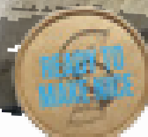
MAJSSALSA MED PIRI PIRI