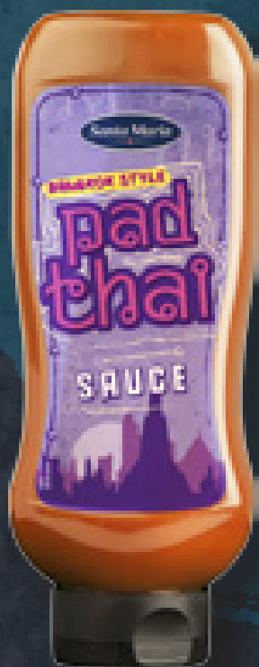
PAD THAI SAUCE 1000 G ART NR. 200108 En asiatisk-inspireret sauce - perfekt til Pad Thai.