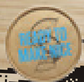
LIME OG KORIANDE

Caribisk mad har været "det kommende køkken" i nogle år nu, og mange forbrugere føler stadig, at det mangler på mange menuer.