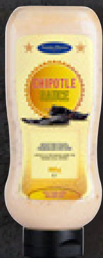
CHIPOTLE SAUCE 890 G ART NR: 4544