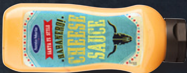
HABANERO CHEESE SAUCE 970 G ART NR. 200106 En stærk og sød toppingsauce - perfekt til burgere.