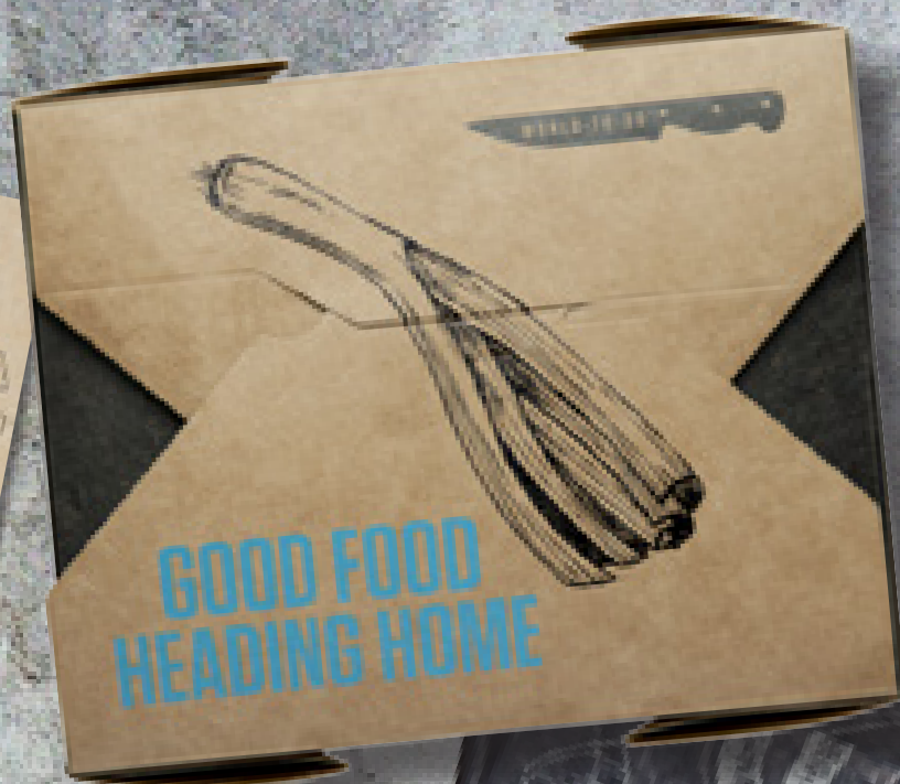
TAKEAWAYBOKS MED TRYK