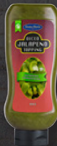
DICED JALAPEÑO 930 G ART NR: 4542