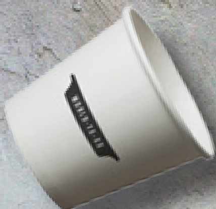
LILLE BÆGER MED LÅG OG TRYK