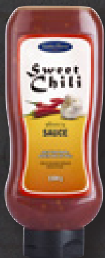
SWEET CHILI SAUCE 1100 G ART NR: 4539