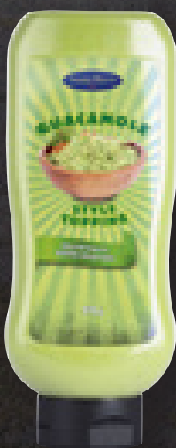
GUACAMOLE STYLE TOPPING 940 G ART NR: 4556