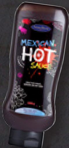
MEXICAN HOT SAUCE 1060 G ART NR: 4543