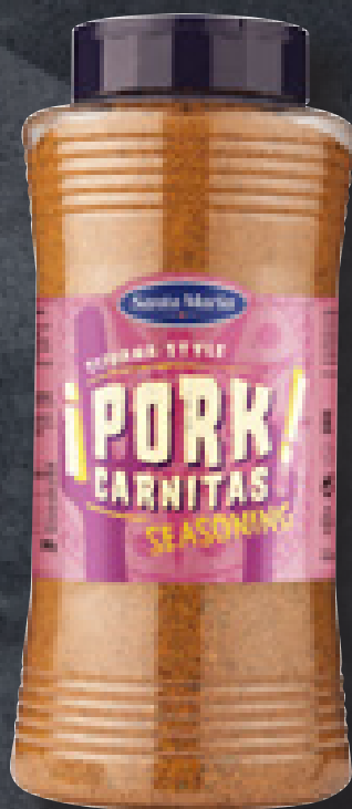
PORK CARNITAS SEASONING 580 G ART NR. 100273 En krydderiblanding til svinekød med et mexicansk touch.

GNID KØDET MED DET, INDEN DET SKAL SIMRE!