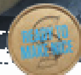
SYLTEDE RØDLØG OG SALAT