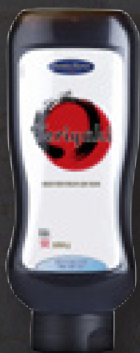
TERIYAKI SAUCE 1090 G ART NR: 4540