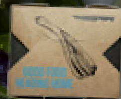
BBQ-KYLLING OG KIMCHI

KoMex er den perfekte blanding mellem koreansk smag og mexicansk enkelhed. Vi har gjort Kimchi enkelt med vores nye hurtigvirkende krydderiblanding. Du blander det bare med hakket salat og lader det trække i køleskabet et stykke tid. Så lægger du ingredienserne i bokse, så kokken derhjemme kan fylde og strege sine fajitas i ro og mag. Glem ikke at vedlægge lidt superhot Sriracha Sauce og en sprød og frisk salat.