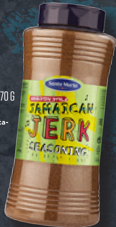
JAMAICAN JERK SEASONING 570 G ART NR. 100274 En krydderiblanding til Jamaica-inspireret kylling.