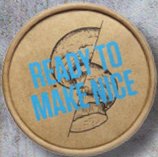
STORT BÆGER MED LÅG OG TRYK